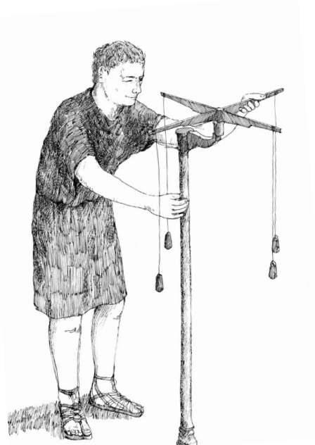
Extret del llibre d'en David Macaulay. Nacimiento de una ciudad romana